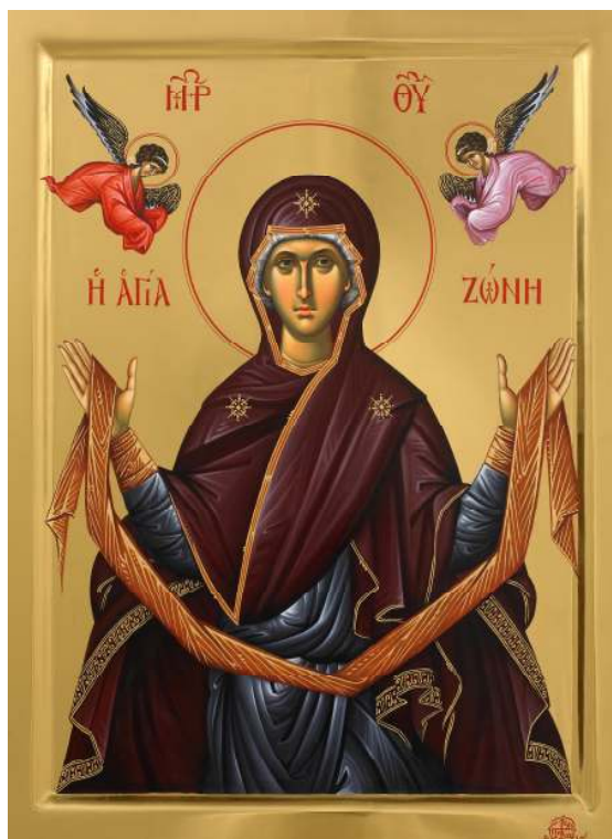
THE PRECIOUS BELT OF THE MOST HOLY THEOTOKOS

404 Meredith Rd. N.E. Calgary, AB T2E 5A6