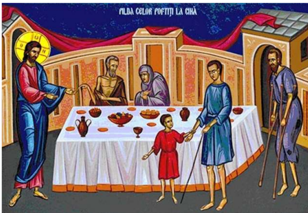
PARABLE OF THE MARRIAGE FEAST

404 Meredith Rd. N.E. Calgary, AB T2E 5A6